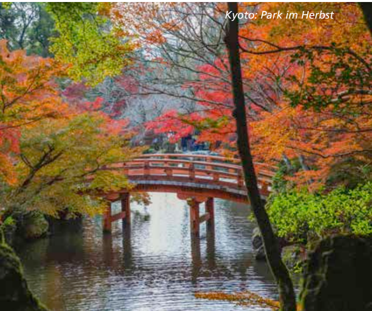
Kyoto: Park im Herbst

Japan 15 Tage 26. Oktober (Sonnabend) bis 9. November 2024 (Sonnabend). Reisepreis: 4.400 € (Reisegrundpreis 3.200 € / Flugpreis ca. 1.200 €), EZ-Zuschlag: 450 €. Reiseorganisation: Shin Yamamoto, N. N. Diese Reise enthält folgende Leistungen: Übern./Frühst. in DZ mit Bad o. Du/WC – eine warme Mahlzeit täglich in ausgewählten Restaurants, Bahnfahrten in Hochgeschwindigkeitszügen (Shinkansen), Express- und Regionalzügen. – Sämtliche Transfers während der Reise, Eintrittsgelder sowie Reiseorganisation.