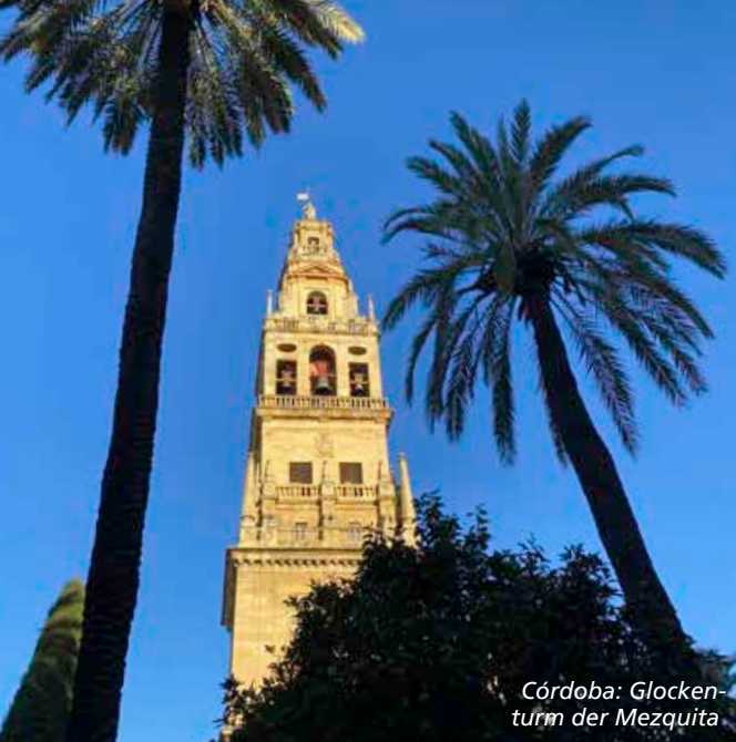
Córdoba: Glockenturm der Mezquita