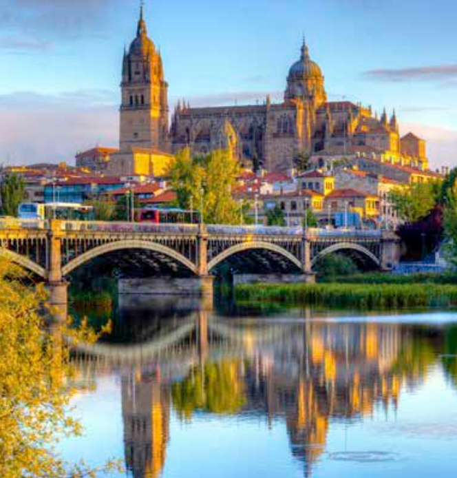
Blick auf Salamanca