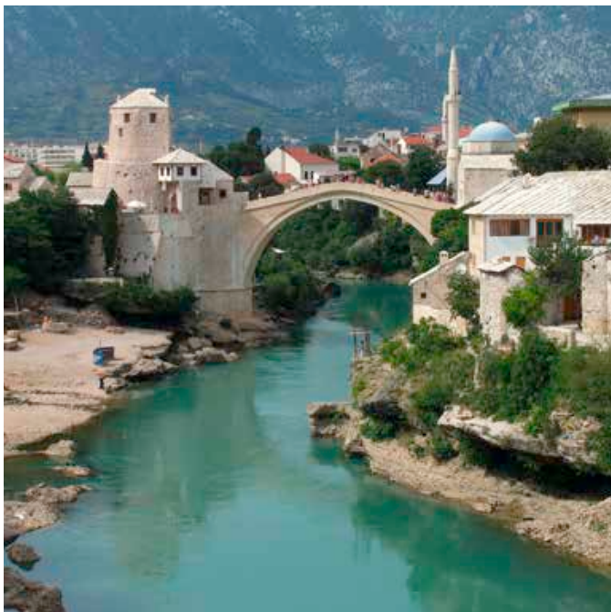
Mostar: Alte Brücke