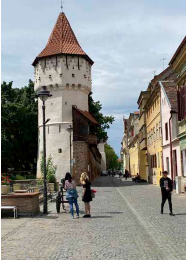
Hermannstadt (Sibiu): Zimmermannsturm