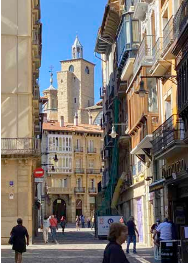
Altstadt von Pamplona